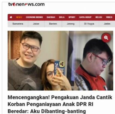
Gambar 2. Judul Berita Tv One News.com