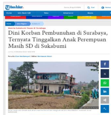
Gambar 9. Judul Berita Tribunnews.com