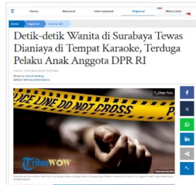
Gambar 8. Judul Berita Tribunnews.com