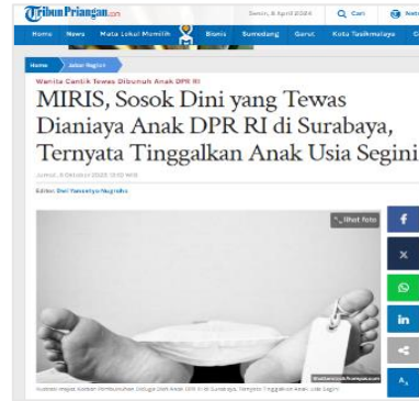
Gambar 7. Judul Berita Tribunnews.com