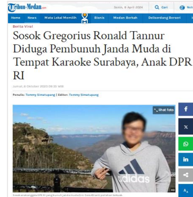
Gambar 4. Judul Berita Tribunnews.com