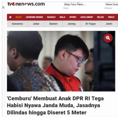
Gambar 1. Judul Berita Tv One News.com