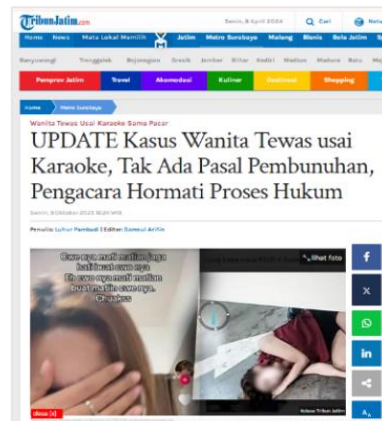
Gambar 10. Judul Berita Tribunnews.com