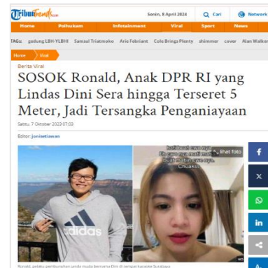
Gambar 5. Judul Berita Tribunnews.com