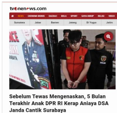
Gambar 3. Judul Berita Tv One News.com