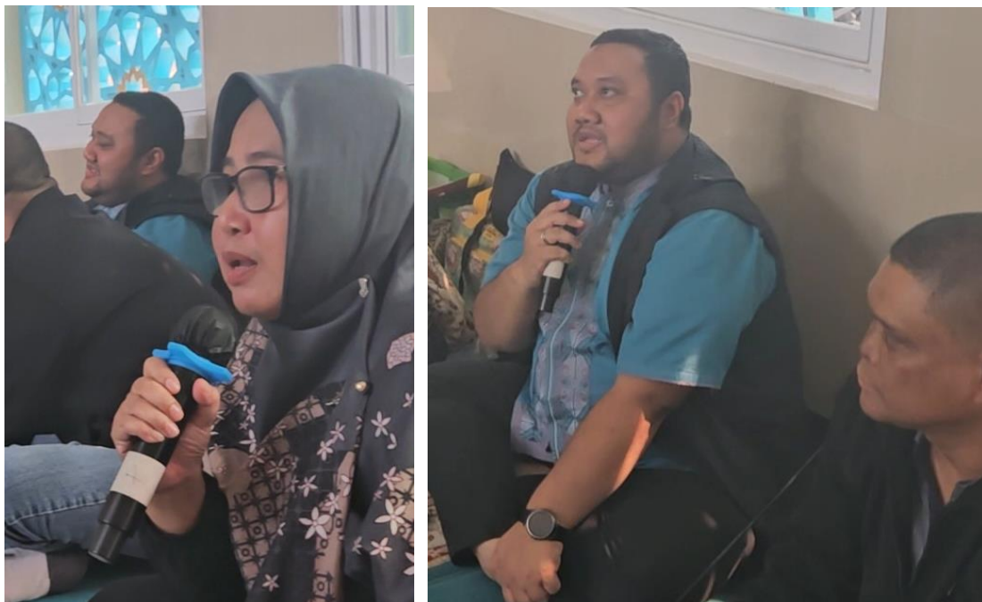
Gambar 7 dan 8. Pemaparan Materi Menciptakan Budaya Keamanan Data

Dengan pemahaman yang baik tentang apa itu phising dan bagaimana cara mengidentifikasinya, ibu-ibu dapat lebih waspada terhadap ancaman keamanan online dan melindungi diri mereka sendiri serta keluarga mereka dari risiko pencurian identitas, penipuan keuangan, atau kerugian lainnya yang dapat timbul akibat serangan phising (Terapi et al., 2022). Selain itu, menjelaskan tentang phising dapat membantu meningkatkan kesadaran mereka terhadap pentingnya menjaga keamanan pribadi di dunia digital yang semakin kompleks ini. Dengan demikian, penyuluhan tentang phising di majelis ta'lim dapat memberikan manfaat yang nyata dalam melindungi anggota komunitas dari ancaman cyber yang merugikan (Dermawan et al., 2021).