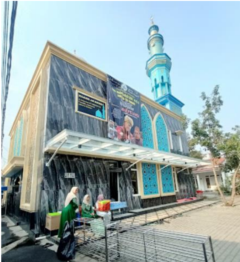
Gambar 1. Mesjid Ar Ridho, tempat dan Lokasi kegiatan PKM

Pelaksanaan kegiatan pengabdian kepada masyarakat (PKM) ini berlangsung pada tanggal 1 Juni 2024 di Majelis Talim Sa'adatunnisa, di Mesjid Ar Ridho, Matoa, Ciganjur, Jakarta Selatan dengan peta atau gambar lokasi seperti berikut ini https://maps.app.goo.gl/x4UEV4oqEzs5TMV88