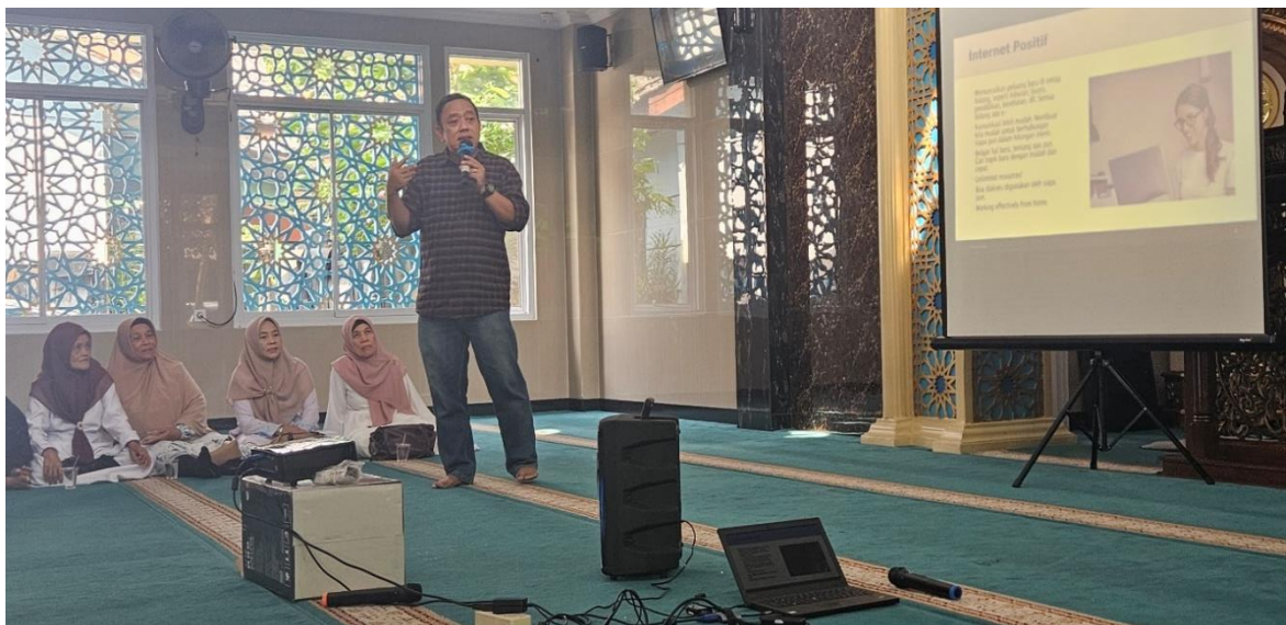
Gambar 3 dan 4. Pemaparan materi "Securing Smartphone"

Selanjutnya, pemateri memberikan langkah-langkah praktis, seperti mengaktifkan fitur kunci layar dengan PIN, pola, atau sidik jari, dan pentingnya memperbarui sistem operasi dan aplikasi secara teratur untuk menghindari kerentanan keamanan. Dijelaskan pula cara mengunduh aplikasi hanya dari sumber terpercaya seperti Google Play Store atau App Store, dan waspada terhadap tautan mencurigakan yang diterima melalui pesan atau email. Selain itu, para ibu diajarkan juga cara menggunakan aplikasi keamanan tambahan, seperti antivirus, dan pentingnya mengatur pencadangan data secara teratur.