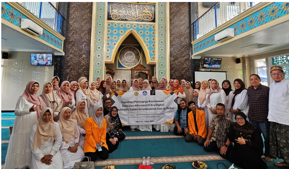
Gambar 10. Sesi Foto Bersama

Sesi diakhiri dengan foto Bersama para peserta penyuluhan dengan para pemateri dari kampus IBIK 57. Harapan dari kegiatan ini adalah untuk meningkatkan kesadaran dan pemahaman anggota majelis ta'lim tentang pentingnya keamanan data dalam kehidupan sehari-hari mereka. Diharapkan bahwa peserta akan dapat mengidentifikasi potensi risiko keamanan data, seperti serangan phishing atau penipuan online, dan menerapkan langkah-langkah praktis untuk melindungi diri mereka sendiri dan keluarga mereka dari ancaman cyber. Selain itu, diharapkan bahwa kegiatan ini akan membangun budaya keamanan data yang kuat di antara anggota majelis ta'lim, di mana mereka saling mendukung dan berbagi pengetahuan untuk menciptakan lingkungan online yang lebih aman dan terpercaya. Pada tingkat yang lebih luas, harapan dari kegiatan ini adalah untuk mengurangi jumlah kasus penipuan online dan pelanggaran data di komunitas, serta meningkatkan kualitas hidup secara digital bagi semua peserta.