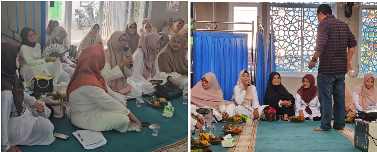
Gambar 5 dan 6. Antusias Para Peserta dalam Diskusi Upaya Phising

Sesi berdiskusi dan berbagi pengalaman, serta jawab pertanyaan dalam berbagi pengalaman terhadap Upaya phising yang pernah terjadi oleh para peserta. Dalam kesempatan ini, menjelaskan konsep phising kepada ibu-ibu anggota majelis ta'lim penting karena mereka sering kali menjadi target potensial dari serangan phising . Banyak ibu-ibu yang mungkin kurang akrab dengan teknologi atau kurang berpengalaman dalam penggunaan internet, sehingga rentan terhadap tipu daya phising .