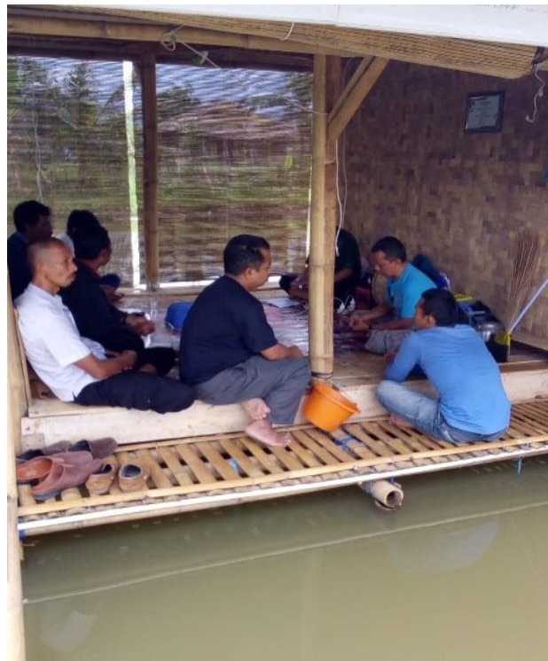
Foto 3. Sosialisasi Cara Membuat Laporan Keuangan