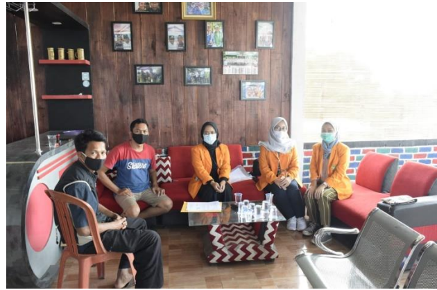
Foto 1. Wawancara